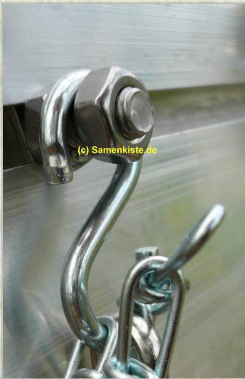
.. und Haken