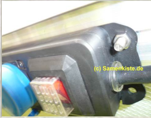
Fixieren von Steckdosen