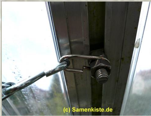
Befestigung von Ösen