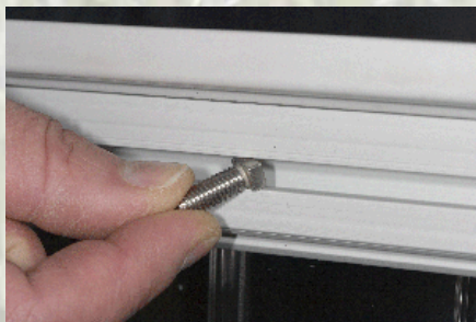
Einfädeln der Hammerkopfschraube

Der Einbau eines Metallreflektors in ein Chelonium®