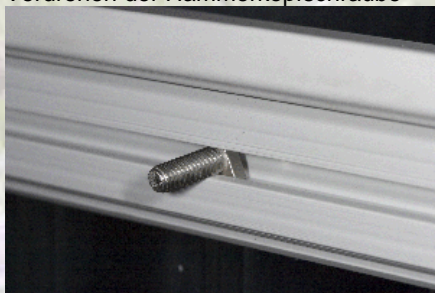
Ansicht nach dem verkanten und vor der Fixierung mittels einer M6-Mutter